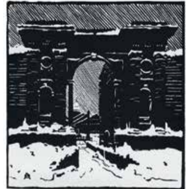
А.П.Остроумова-Лебедева «Ленинград. Новая Голландия»

произведений мастера из частных коллекций, посвящённых, главным образом, Петербургу.