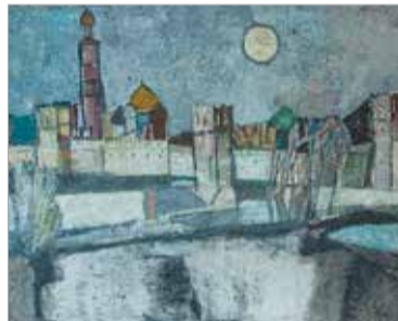
«Новодевичий монастырь». 1990