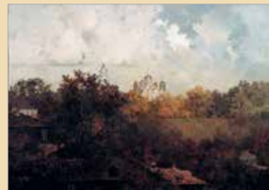
«Владимир. Вид на Успенский собор». 1995

Глубоко национальный характер творчества Изотова проявился не только в воплощении характерных черт русского пейзажа, но и в рождённой Православием убеждённости в гармонии мира, в ясности его иерархической структуры, в существовании цели, дающей всему смысл, в осиянности и признанности всего неземным светом Преображения.