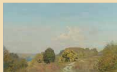
«Над Окой». 2006