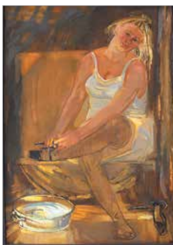
«После бани». 2008