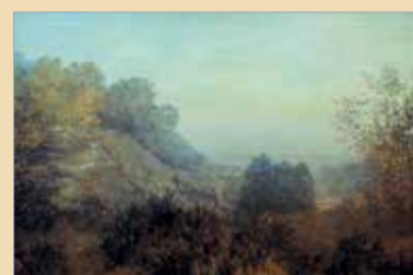
«Дорога на Муром». 1996