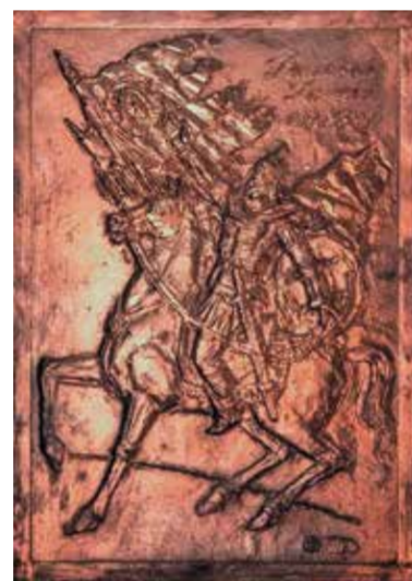
Плакетка «Дмитрий Донской»