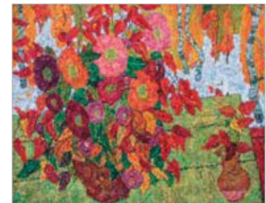
«Снег и цветы». 1979