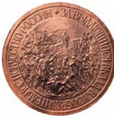
Реверс медали Александра Иванова