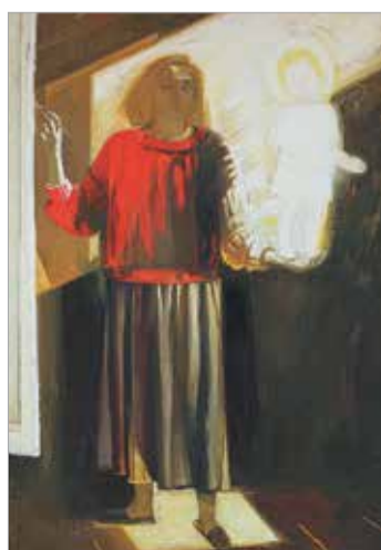
«Автопортрет с Ангелом-хранителем». 1993