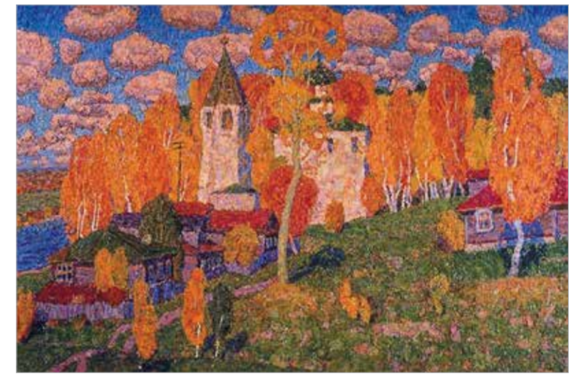
«Село Любец». 1985

Окружённые немецкими войсками, в так называемый Уманский котёл попали сто пятьдесят тысяч солдат и офицеров РККА. По разным сведениям, были взяты в плен до пятидесяти тысяч советских солдат. В их числе