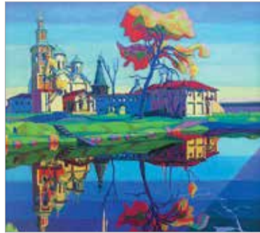
Г. Калинин. «Спасо-Прилуцкий монастырь». 2000

и любили как на Вологодчине, так и в Северо-Западном регионе, ценили в Москве.