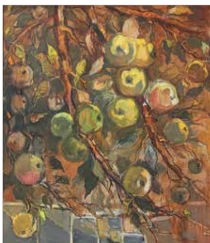
«Антоновка созрела». 2001