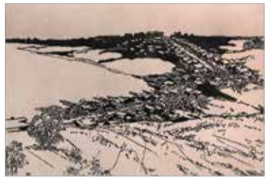
Н.В.Синицын. «Деревня зимним вечером на месте Орехово-Борисово»

Это знаменитые цветные ксилографии, автолитографии, акварели, рисунки, работы, созданные в зарубежных поездках – Италии, Франции, Финляндии, а также широко известная серия открыток «В помощь Общины Св. Евгении» 1904–1913 гг. с изображением архитектуры Петербурга и полевых цветов.