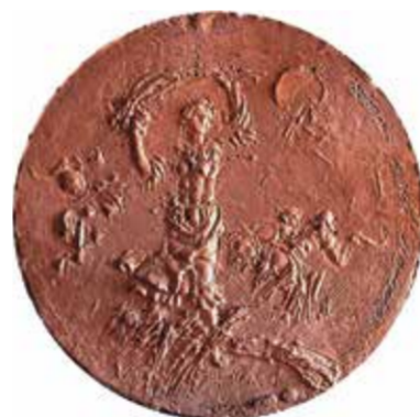
Модель медали «Жизница»