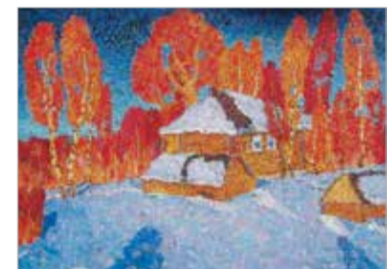
«Село Любец». 1985