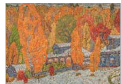
«Ранний снег». 1974–1975

17 марта 1945 г. лагерь был освобождён. Войска 1-го Украинского фронта, прорвав оборону, вошли в Ламсдорф. Совинформбюро сообщало: «В этом населённом пункте наши бойцы освободили свыше четырёх тысяч советских граждан,