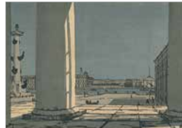
А.П.Остроумова-Лебедева «Нева сквозь колонны Бирж»