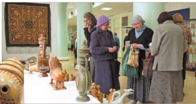
В залах выставки