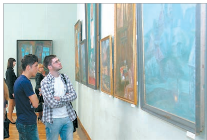
В залах выставки