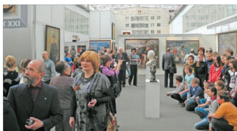
На открытии выставки сибирских художников

Выставку можно назвать долгожданным художественным событием в крае, давшем возможность для жителей и гостей города познакомиться с красноярской школой изобразительного искусства, осознать целостную систему профессионального художественного образования, различить жанровые предпочтения. В наши дни Красно-