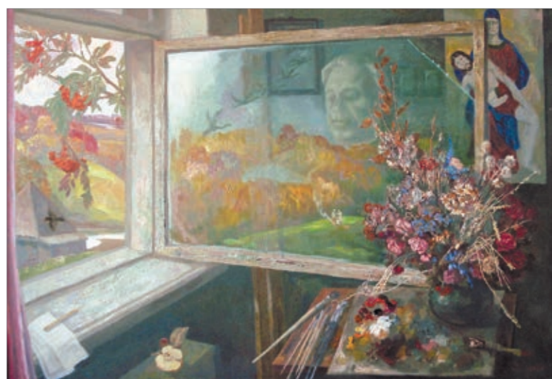
«Осень в моей мастерской»

Мастер работал в области живописи, графики, в жанрах тематической картины, портрета, пейзажа, интерьера, натюрморта. Его произведения хранятся в Государ-