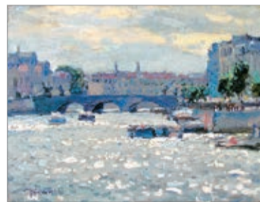
«Аничков мост». 2012

Экспонируемые работы – это не подражание творчеству перечисленных блестящих художников, а собственное осмысление и дальнейшее развитие художественных и эстетических ценностей в данном направлении искусства. Каждый из представленных авторов выражает своё отношение к окружающей природе, ценя, в первую очередь, именно реальность этой ускользающей красоты.