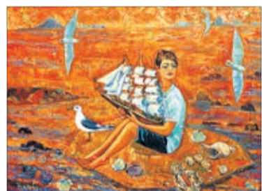
«Семен. Золотые острова». 2010

Творчество Ольги Никитчик – другая стихия. Декоративные полотна, экспрессивные по цвету, насыщенные образами, от которых исходит энергия жизни, неожиданно оказываются очень женскими, притягательными, с вдруг открывающейся беззащитностью. Выросшая в семье художника Кима Ковалева, одного из основателей уссурийской школы, Ольга пришла в искусство довольно рано, участвуя в серьезных выставках практически с институтской скамьи.