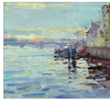
«Утро у Эрмитажа». 2012