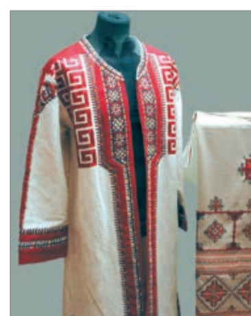
Работа М. Симаковой

В залах выставки, размещенной в анфиладе первого этажа галереи «Хазинэ», экспонируются произведения художников, работающих в Республике Чувашия, и представителей чувашской диаспоры в Республике Татарстан.