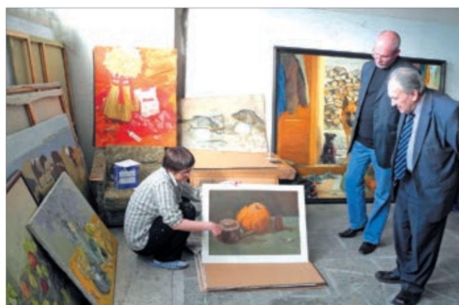
Обсуждение работ для выставки