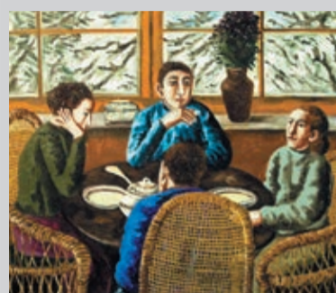
Н. Нестерова. «Суп из спаржи». 2009

Впервые за 80-летнюю историю Московского союза художников в залах Московского дома художника на Кузнецком мосту, прошла выставка «Метафизика в изобразительном искусстве», на которой были представлены живописные работы, скульптура, плакат, графика и произведения декоративного искусства.