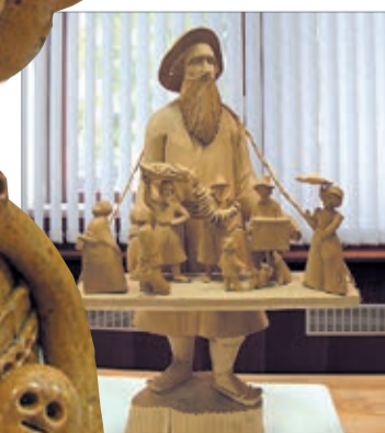
Богородская скульптура С. Паутова