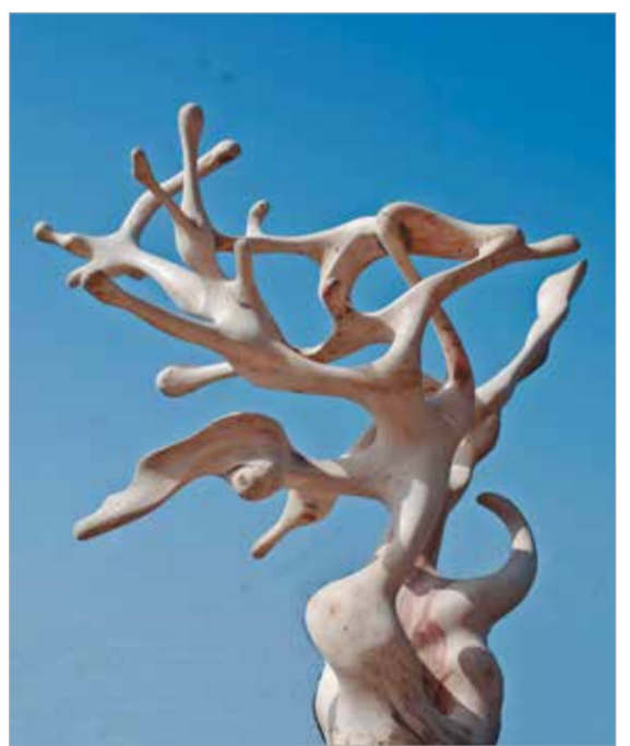
Ю. Сахаров. «Освобождение». 2012