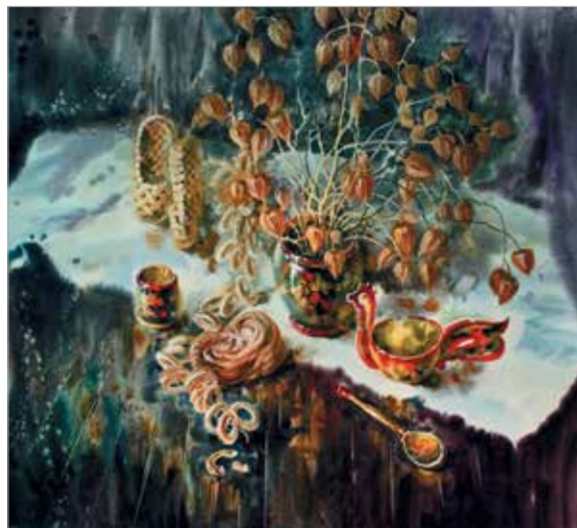
Л. Герасимов. «Сухоцвет»

Главная тема выставки – тема родного ему с детства Симферополя, реконструкция его красивых, уютных, утопающих в зелени старинных зданий и улиц довоенного и послевоенного города – так же, как и горестные страницы военного времени не оставит равнодушными