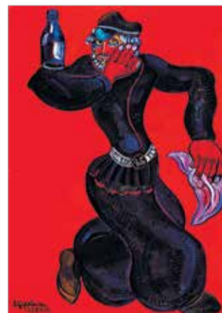
Из серии «Старый Тифлис». 2013

В залах Музейно-выставочного комплекса «Новый Иерусалим» проходит выставка произведений крупнейшего художника-монументалиста, народного художника СССР и РФ, президента Российской академии художеств З.К.Цертели. Устроители выставки – Министерство культуры Московской области, Музейно-выставочный комплекс «Новый Иерусалим» и Российская академия художеств.