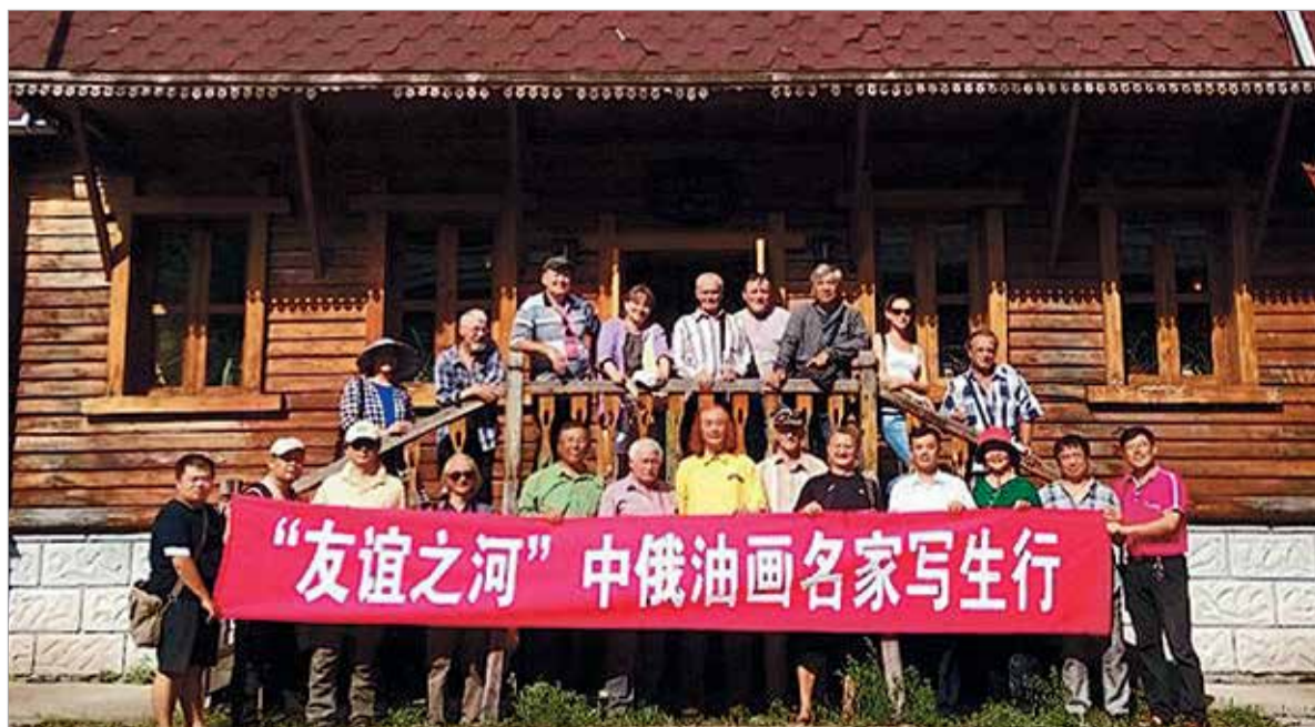
Общая фотография участников пленэра