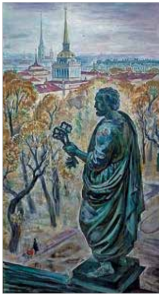
«Хранитель города». 2002

В залах Российской академии художеств проходит выставка произведений известного петербургского живописца, рисовальщика, монументалиста Михаила Кудреватого «Ступени». Около пятидесяти произведений разных лет представят творчество этого интересного мастера.