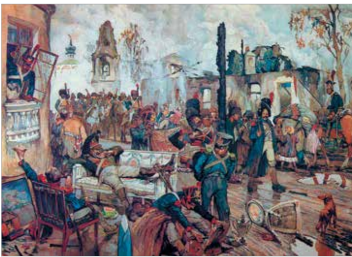
«Москва в сентябре 1812 года». 1913