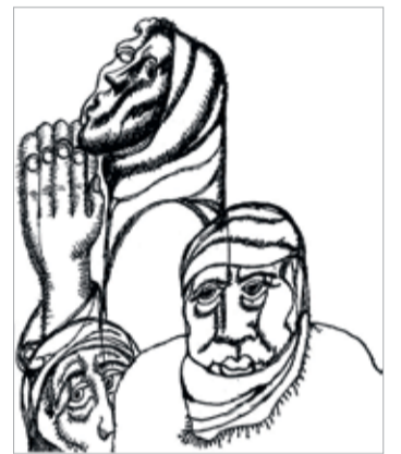
Из серии «Листы из альбома». 2010

Основная часть экспозиции, в состав которой вошло более двухсот работ, выполненных за последнее десятилетие, представлена живописными и графическими произведениями. Выставка убедительно демонстрирует силу характера, энергию, дерзновенные поиски и оригинальность художественного видения мастера, которому подвластны все виды, жанры и техники изобразительного искусства. Монументальные скульптурные композиции, выполненные З.К.Цертели, украшают улицы, площади, государственные и общественные здания многих стран мира.