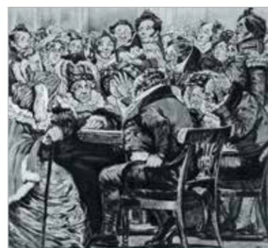
Иллюстрации к комедии А.Грибоедова «Горе от ума». 1912