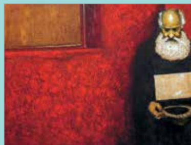
Ю. Григоряна. «Memento». 2005

В Галерее искусств Зураба Церетели проходит выставка живописных произведений заслуженного художника РФ, члена-корреспондента Российской академии художеств Юрия Суруновича Григоряна и члена Союза художников Юрия Юрьевича Григоряна.