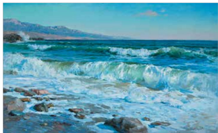
А. Смирнов. «Крымский берег»