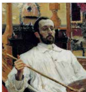
И. Репин. «Портрет Д. Кардовского» 1896–1897

Происшедшая в 1917 году Великая Октябрьская социалистическая революция наложила отпечаток на всё последующее развитие художественной жизни России. Целый ряд художников покидает страну, а оставшиеся, несмотря на все трудности, продолжили в нарождающемся обществе поиски новой сюжетной линии в своем творчестве. Д.Н.Кардовский на некоторое время уезжает на свою малую родину. И здесь в уединении и тишине он начал активно заниматься художественным оформлением книги, проиллюстрировав целый ряд известных литературных произведений: «Муму» И.Тургенева, «Каштанка» А.Чехова, «Горе от ума» А.Грибоедова, «Ревизор» и «Невский проспект» Н.Гоголя, «Война и мир»