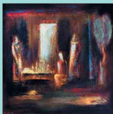
Ю. Григоряна. «Разговор». 2008

Более шестидесяти произведений Юрия Суруновича находятся в собраниях крупнейших художественных музеев и галерей России и стран СНГ, а также в российских и зарубежных частных коллекциях, например, М.С.Горбачева, Альберта Гора и др. На счету художника участие более чем в двухстах выставках и десятках аукционов, в т.ч. благотворительных.