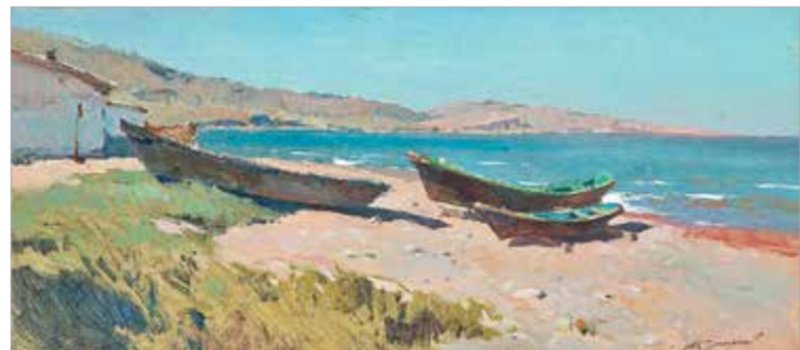
А. Смирнов. «Выходной день»