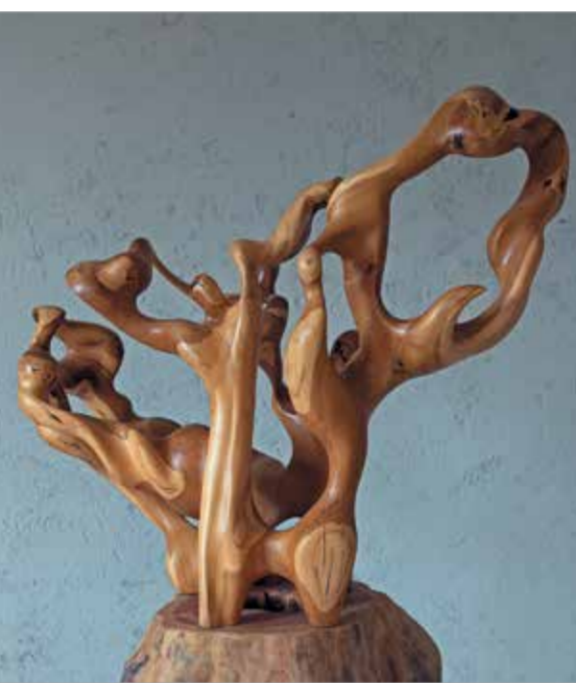
Ю. Сахаров. «Ветер, море, птицы». 2000–2003