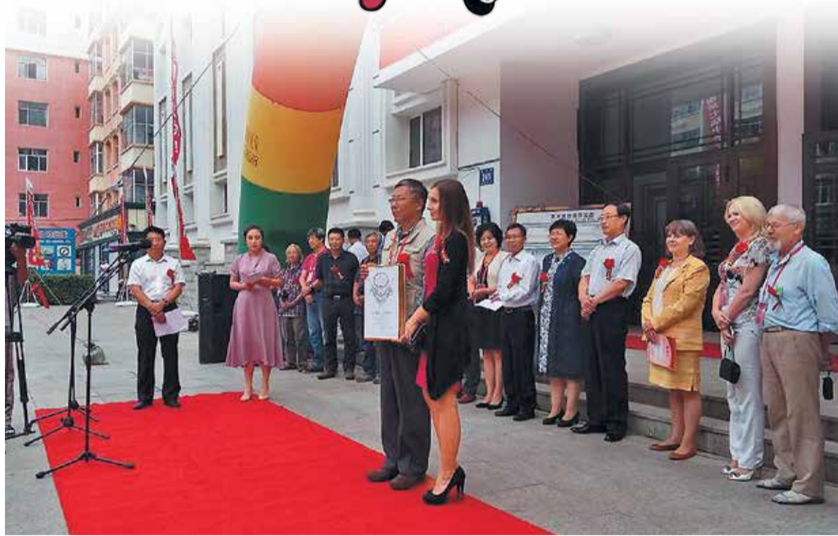
На открытии выставки. Вручение дипломов

В стороне от фестиваля не остался и Союз художников России.