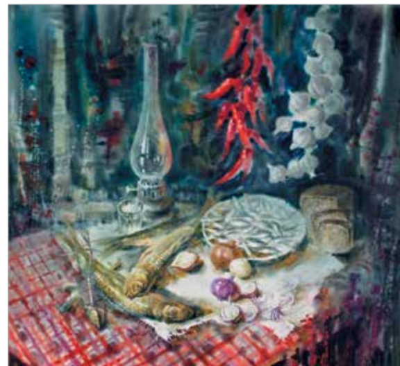
Л. Герасимов. «Натюрморт с копченой рыбой»