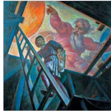
«Микеланджело. Сотворение мира». 2014

ний». Родной город запечатлен им в камерных мотивах, жанровых композициях, выразительных панорамных пейзажах. На выставке представлены ключевые работы цикла «Хранители города», одна из ранних работ художника «Осенний мотив», а также триптих «Ленинградский трамвай», посвященный ленинградской блокаде.