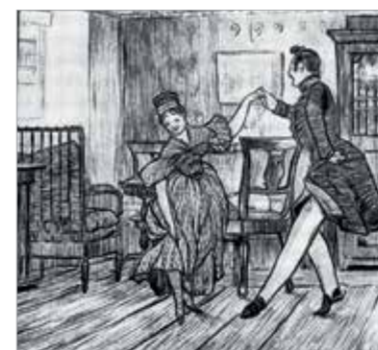
Иллюстрации к повести Н.Гоголя «Невский проспект». 1904