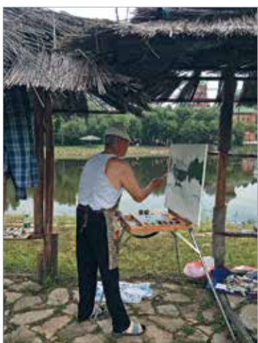
На пленэре. Первые мазки