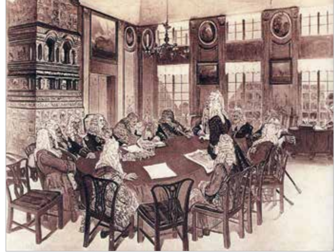
«Сенат петровского времени». 1908

Л.Толстого и других, но самым значительным из них был роман А.С.Пушкина «Евгений Онегин».