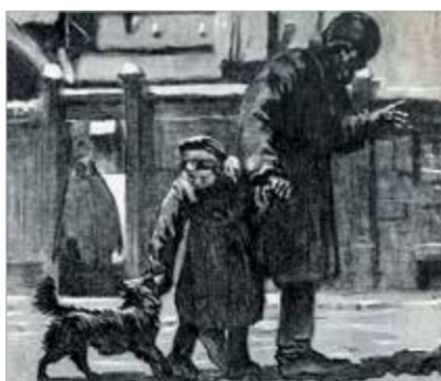
Иллюстрации к рассказу А.Чехова «Каштанка». 1949