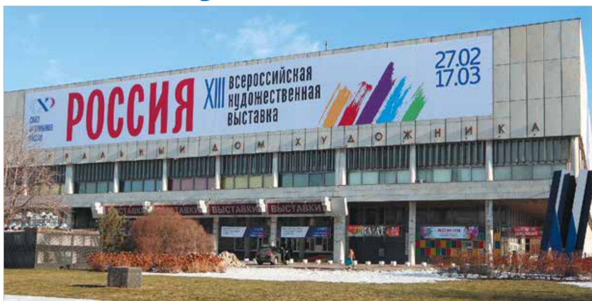
Центральный Дом художника - место проведения выставки

Художественная выставка «Россия» проводится в тринадцатый раз и заслуживает особого внимания, поскольку остается самой значимой для российских художников. Она завершает пятилетний проект, в рамках которого в течение 2018 года в каждом федеральном округе состоялись предварительные отборочные выставки (Новокузнецк, Нижний Новгород, Ростов-на-Дону, Москва, Петропавловск-Камчатский, Челябинск, Мурманск, Липецк). В целом в проекте приняли участие более 6,5 тыс. российских художников. Только в Москве на выставке участвует