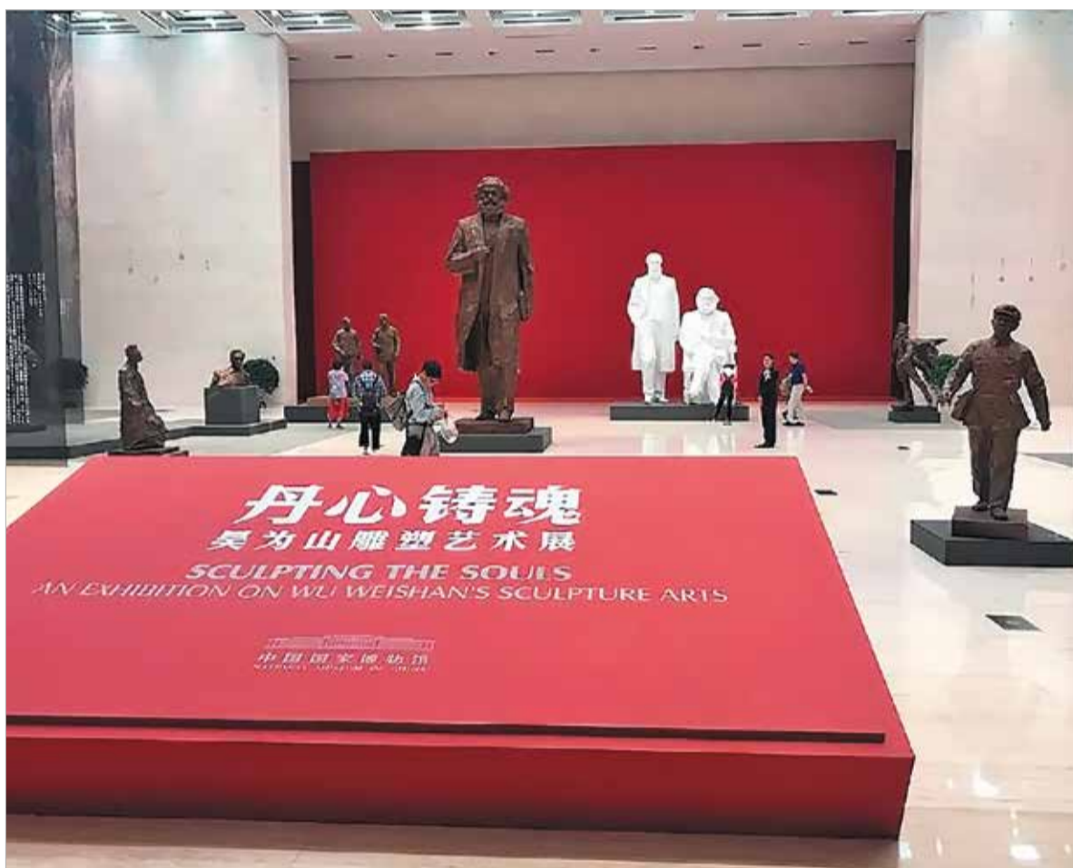
Центральный зал выставки

Особое решение нашел Ву Вэйшань в 5,5-метровой бронзовой скульптуре Карла Маркса, которая была преподнесена в 2018 году правительством Китая в дар городу Триру, где родился немецкий экономист и философ (тогда – Королевство Пруссия, сейчас – земля Рейнланд-Пфальц). Акция дарения была посвящена 200-летию со дня рождения мыслителя и проходила на самом высоком уровне: в церемонии открытия памятника и его передачи городу участвовал председатель Китайской народной республики Си Цзиньпин. «В нынешнюю эпоху моя работа привлечет к себе большой интерес, потому что Китай сейчас находится в центре международного внимания. Я создал образ шагающего Карла Маркса и объединил в работе влияние китайской и западной культуры», – сказал Ву Вэйшань. «В процессе творения мое понимание того, кем был Маркс, кратко расширилось. Он работал на благо всех людей, стремился раскрыть научные