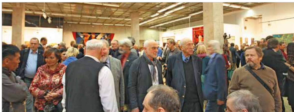
Участники и гости выставки «Россия XIII»

около 2 тыс. авторов. Проект представляет собой методическую работу с регионами по поддержанию творчества наиболее одаренных мастеров изобразительного искусства. Благодаря ему, каждый может заявить о своих достижениях, сначала в своем федеральном округе, затем – в Москве. Проект носит открытый характер, в нем принимают участие все желающие, от Калининграда до Сахалина и Камчатки, от Осетии до Салехарда и Мурманска. Этот во многом традиционный, но самый значимый (главный), выставочный проект Союза художников России дает возможность раз в год видеть, как развивается искусство самых отдаленных районов государства.