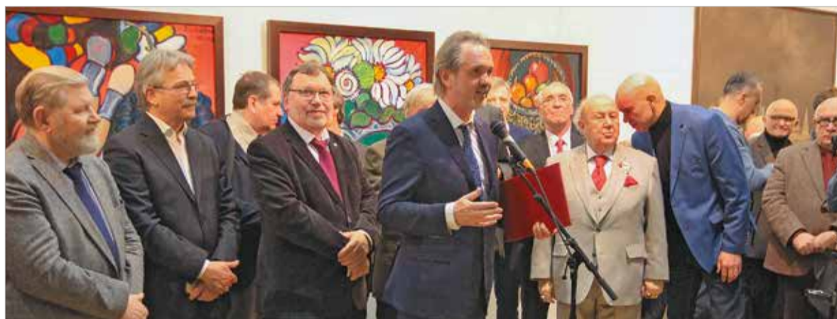
Открытие Всероссийской художественной выставки «Россия XIII»