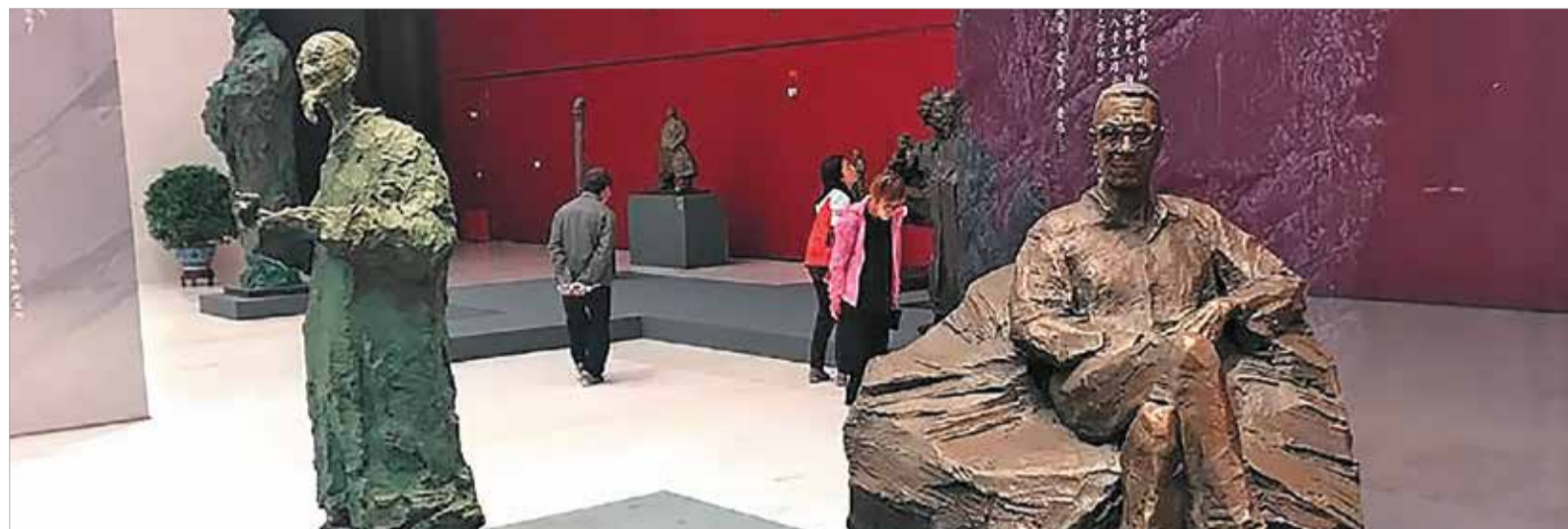
В залах выставки