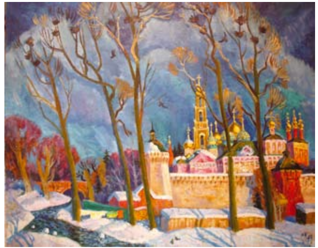
Н. Куц «ВЕЧНА» холст, масло.