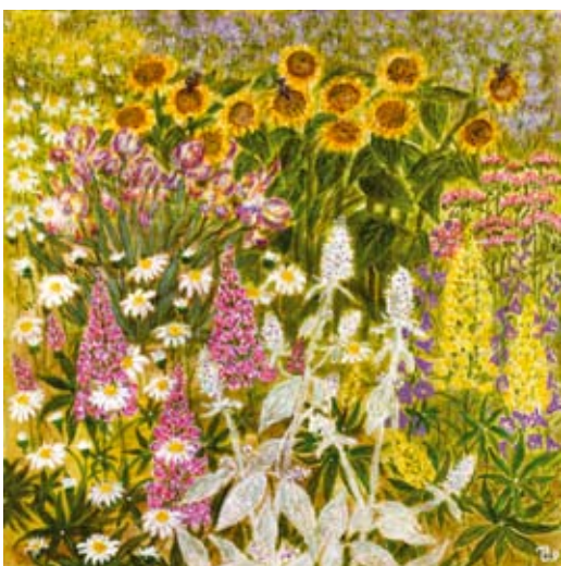
«ПОЛЯНА С ПОДСОЛНУХАМИ». холст, акрил

у кого-то дома висят твои картины. Я уже раздарила около 40–50 работ. Но я скажу по ним.