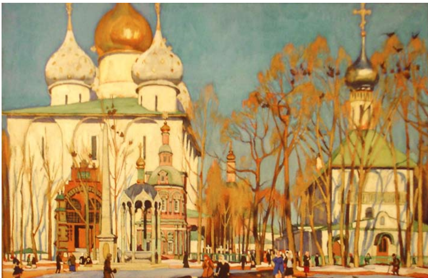
«В СЕРГИЕВОЙ ЛАВРЕ. УСПЕНСКИЙ СОБОР». 1920. акварель, бумага

«Сильно взволновали меня красочные памятники этого сказочно прекрасного городка, исключительного по ярко выраженной русской народной декоративности».