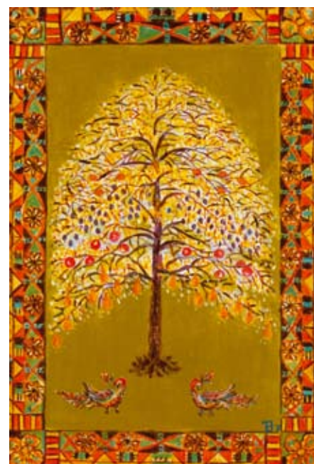
«ВОЛШЕБНОЕ ДЕРЕВО». холст, акрил