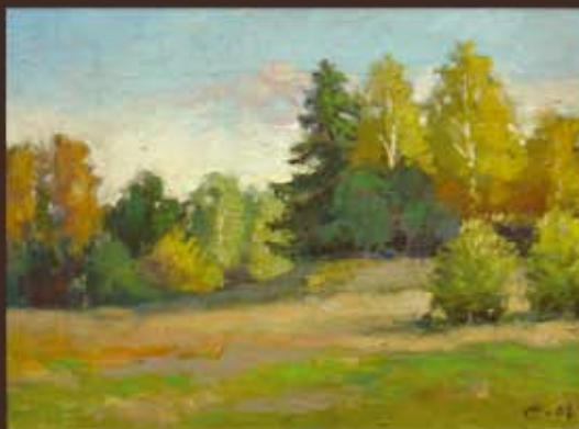
С. Свердлов "ОСЕНЬ" х. м. 30x40 см. / 7000 руб.