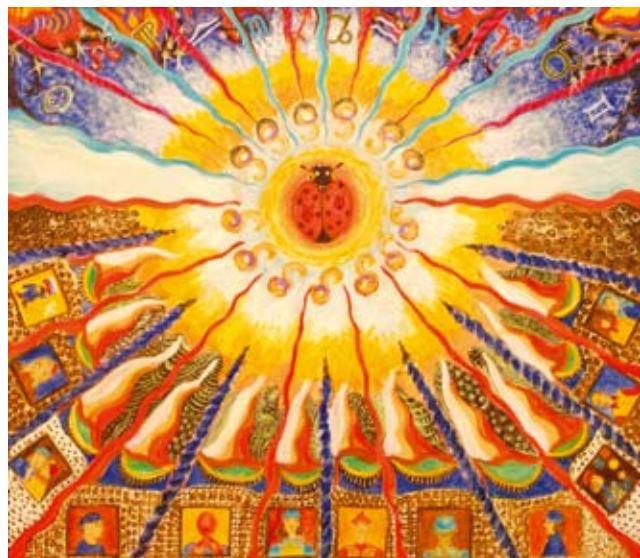
«КАРУСЕЛЬ». холст, акрил

И мы пока решили обходиться без продаж. Слава Богу, можно себе это на данный момент позволить. Некоторым моим друзьям работы нравятся. Им я дарю. И есть даже определенная очередь. Согревает душу, что