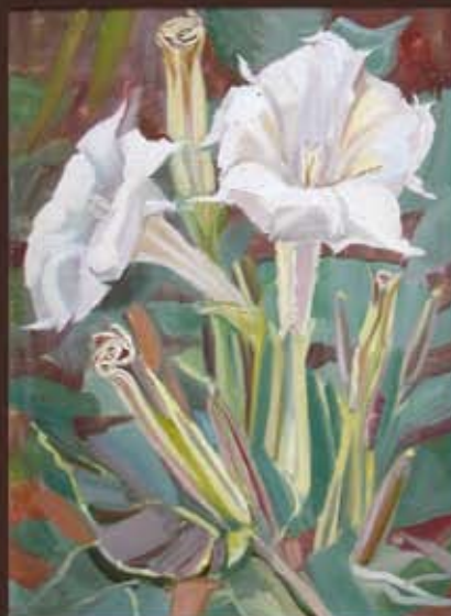
Н. Рыкунова "БЕЛЫЕ ЦВЕТЫ" х. м. 30x40 см. / 7000 руб.