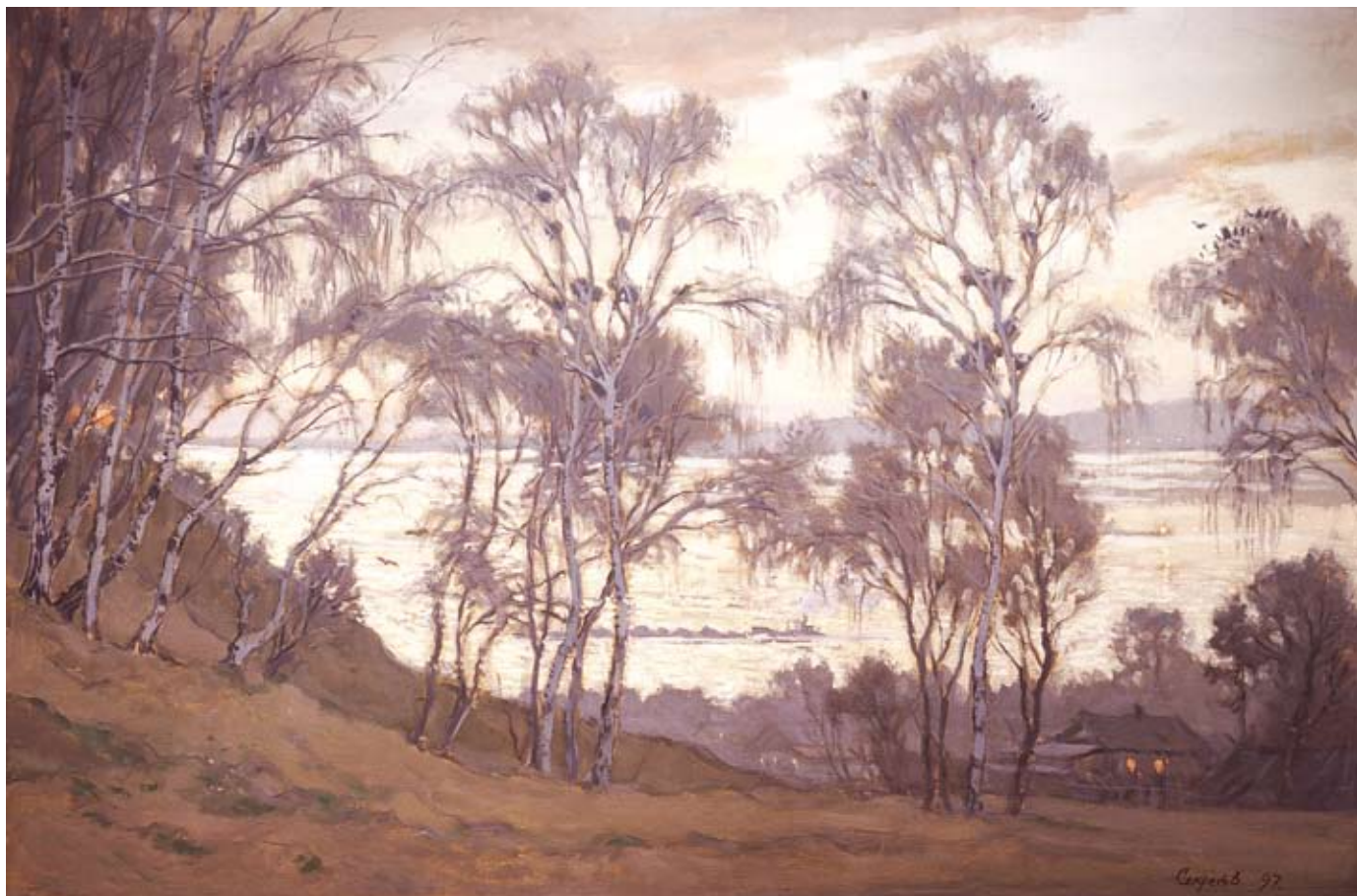
«ВЕЧЕРНЕЕ КРУЖЕВО. ВОЛГА». холст, масло. 1999г.