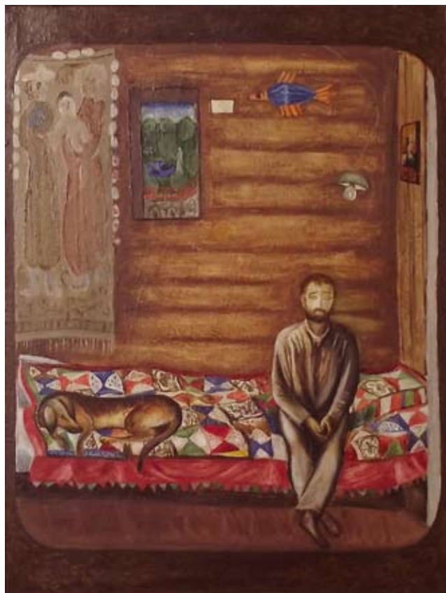
«ИЗ ЖИЗНИ ХУДОЖНИКА». холст, масло. 1974г.