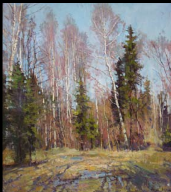
"ТЕПЛЫЙ АПРЕЛЬ". холст, масло. 2004г.