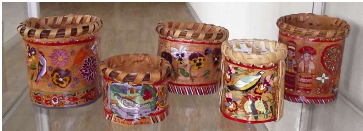
ТУЕСА С РОСПИСЬЮ