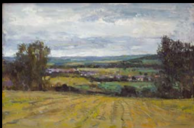
"ОСЕНЬ В ГРАФСТВЕ СОРЕЙ". холст, масло. 2005г.