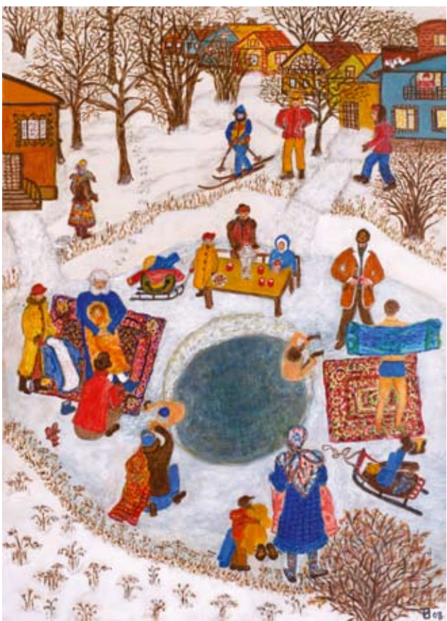
«КРЕЩЕНИЕ». холст, акрил