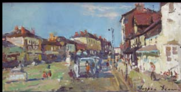
"ДЕРЕВНЯ ВЕСТРУМ. АНГЛИЯ". холст, масло. 2005г.