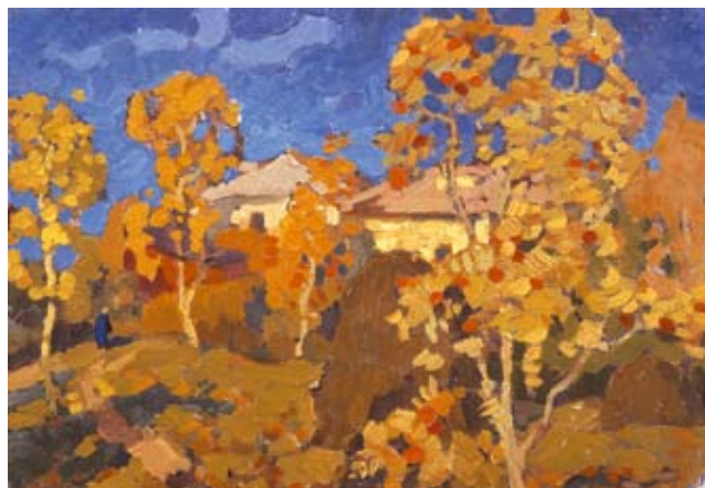
«ОСЕННИЙ ПЕЙЗАЖ». холст, масло. 1968г.