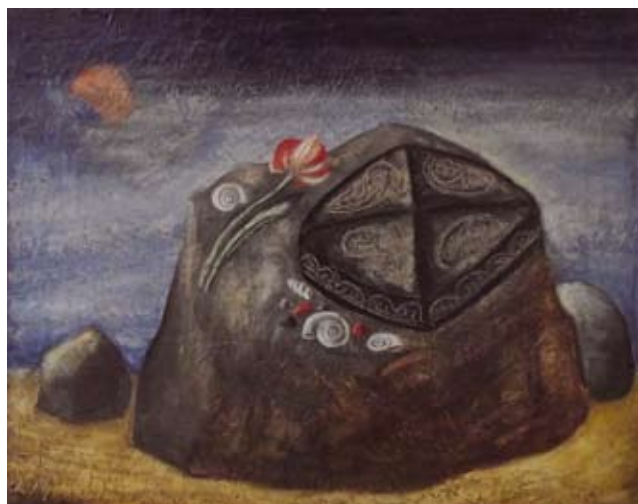
«ЗАТМЕНИЕ СОЛНЦА НАД ОЗЕРОМ ИССЫК-КУЛЬ». холст, масло. 1977г.