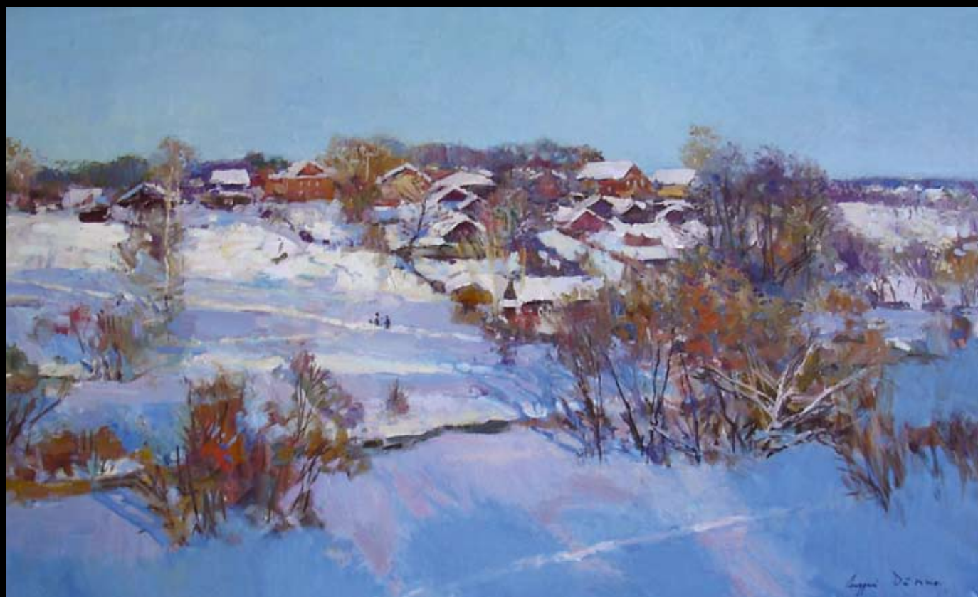
"ЗИМНЕЕ СОЛНЦЕ". холст, масло. 2006г.