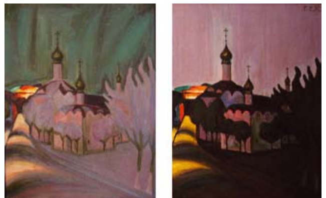
С. Гончаров «ДЕНЬ-НОЧЬ» холст, масло. (диптих)