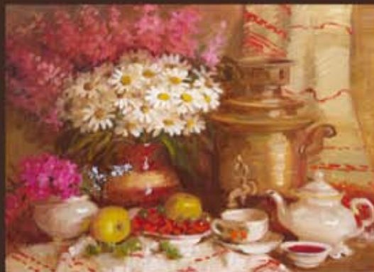
Н. Сазонова "НАТЮРМОРТ С САМОВАРОМ" х. м. 60x80 см. / 21000 руб.