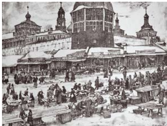
«ПОД КРАСНОЙ БАШНЕЙ». автолитография