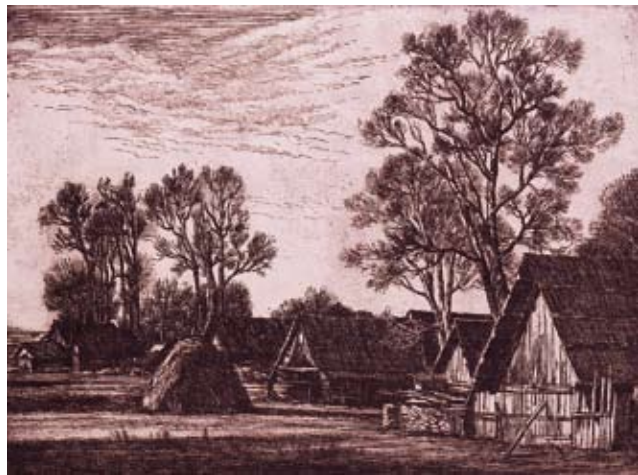
«ВЕЧНОЙ В ДЕРЕВНЕ». офорт. 1984г.