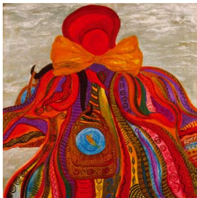
«ТЕТКА С КОРОМЫСЛОМ». холст, акрил