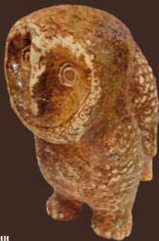
Е. Дюмин "СОВА" керамика 24см. / 2800 руб.