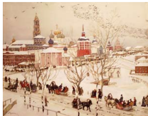
«ВИД НА ЛАВРУ С ВОКЗАЛЬНОЙ УЛИЦЫ». 1920. акв., бум..