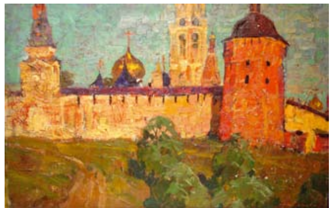
А. Колесников «ЛАВРА» холст, масло.