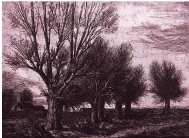
«ОСЕННИЙ ВЕЧЕР». офорт. 1984г.