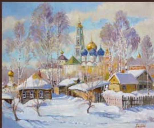
В. Багров "РАДОСТНЫЙ ДЕНЬ" х. м. 50x65 / 14000 руб.