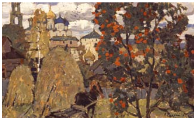
«ОСЕНЬ В ЗАГОРСКЕ». холст, масло. 1969г.