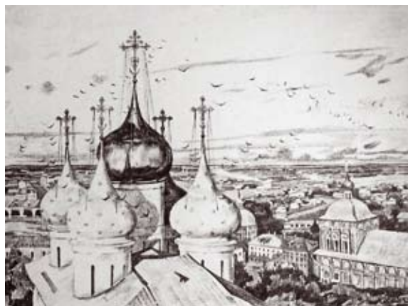
«КУПОЛА И ЛАСТОЧКИ». автолитография