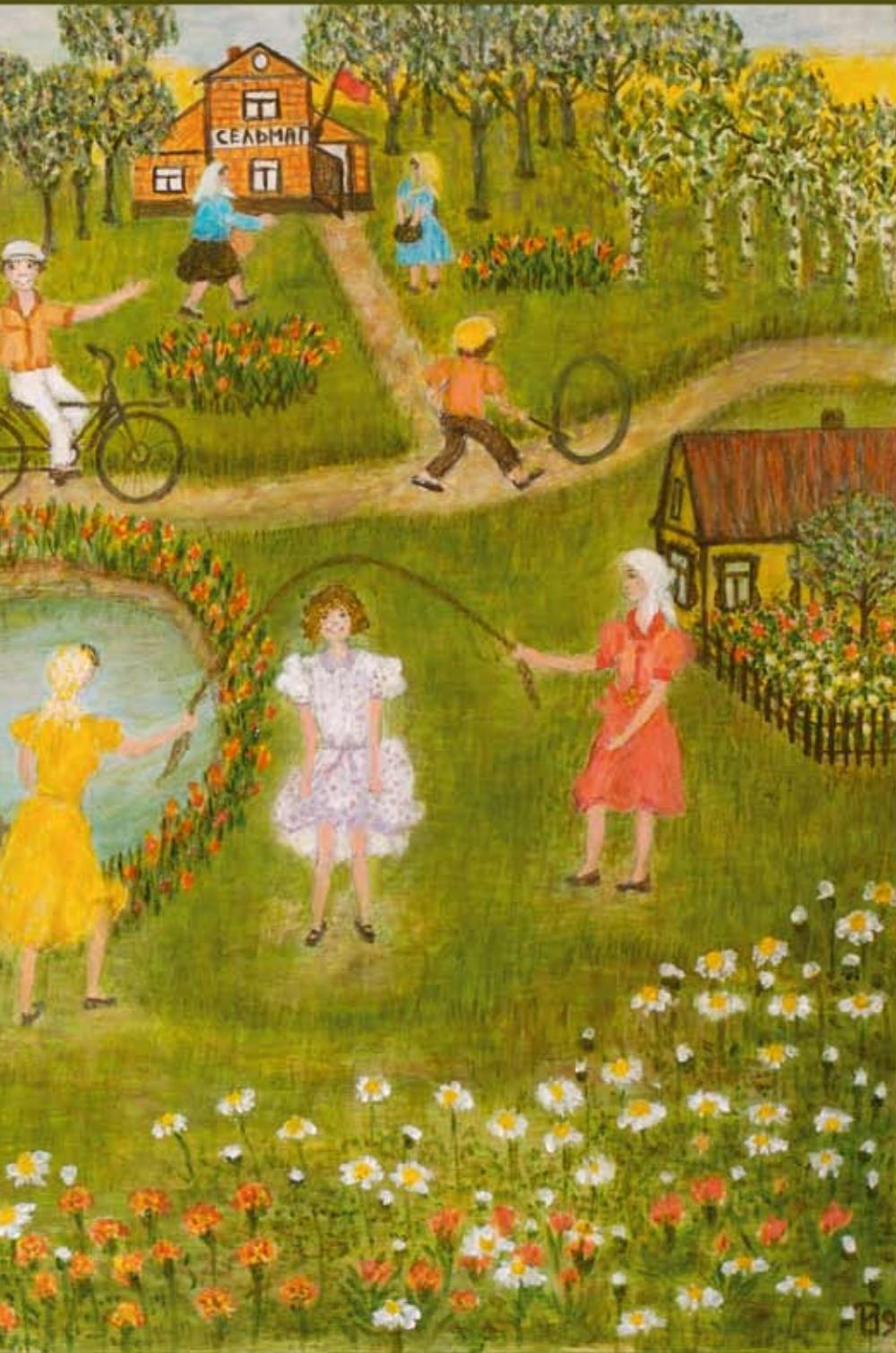
В. Теличкина "НАЗАД В СССР" (холст, акрил)

Россия Московская обл. Сергиев Посад ул. Шлякова, 2а