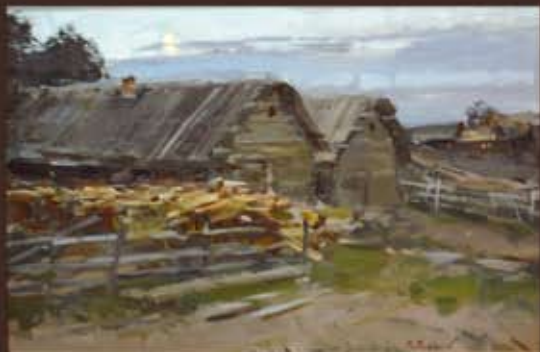
М. Пузырев "ВЕЧЕР" х. м. 30x45 см. / 9100 руб.