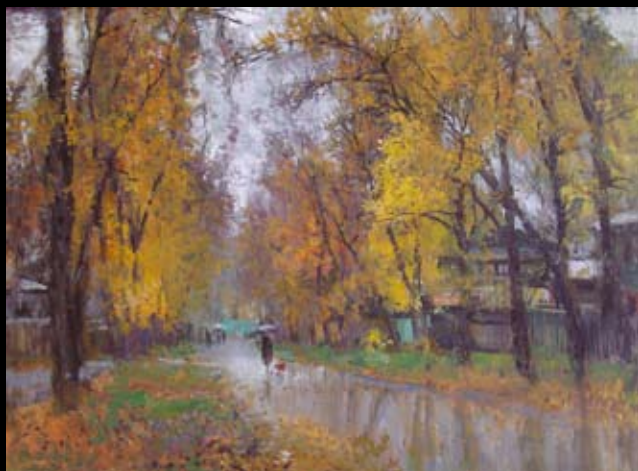
"ОСЕННЕЕ РАВНОДЕНСТВИЕ". холст, масло. 2007г.