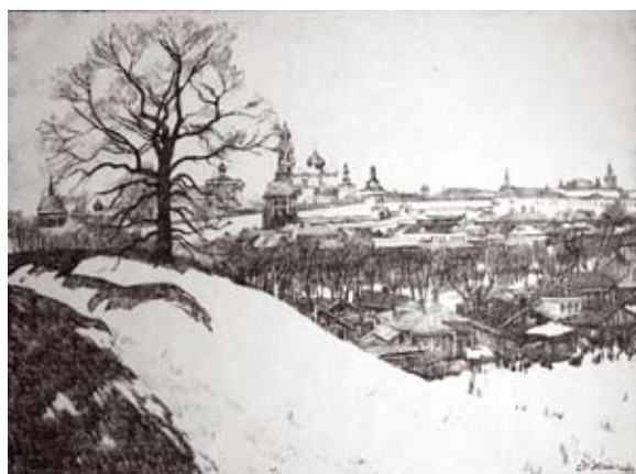
«ВИД НА ЛАВРУ С ДУБОМ». автолитография