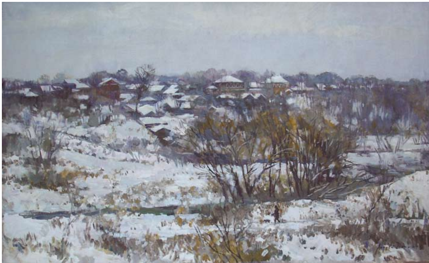
“ПЕРВЫЙ СНЕГ. СЕРГИЕВ ПОСАД”. холст, масло. 2005г.