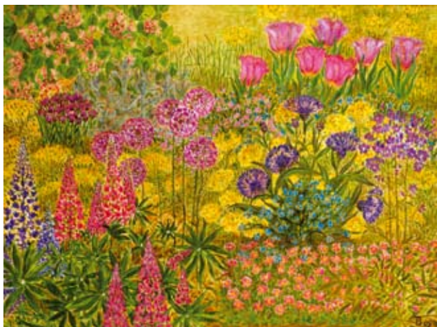
«ИЮНЬСКАЯ ПОЛЯНА». холст, акрил