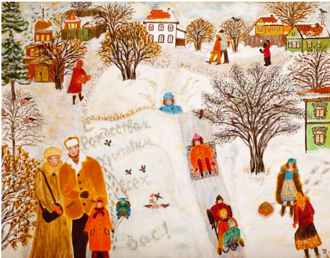
«РОЖДЕСТВО». холст, акрил.