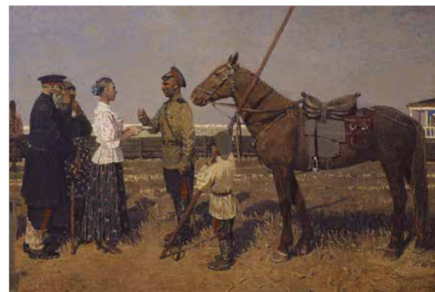
«Стремная. Казачьи проводы». 1999

общества и творца, в том числе и посредством сохранения такой формы, как «творческая мастерская». В нестабильной социальной обстановке, когда обстоятельства порой вынуждают художника, окончившего вуз, работать не по специальности, возможность заниматься любимым искусством в стенах Академии становится настоящим спасением.