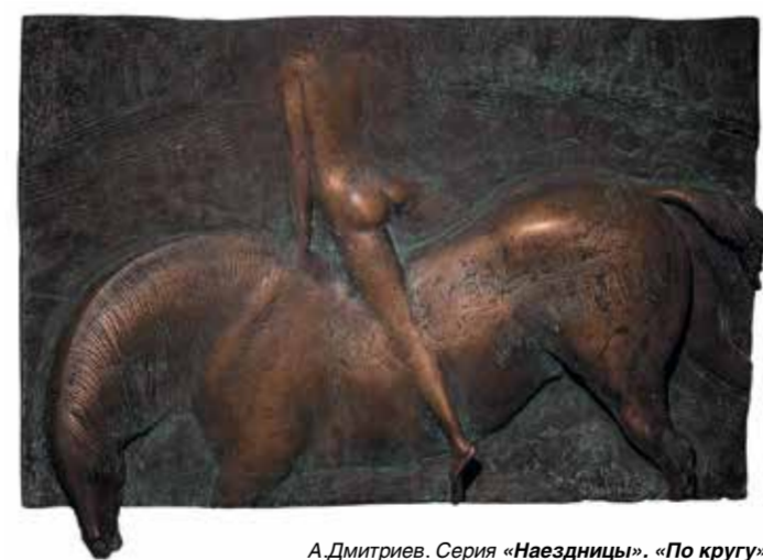
А. Дмитриев. Серия «Наездницы». «По кругу»

Выставочный проект «Учителя и ученики» сложился из ряда представляющих выставок с участием академиков Российской академии искусств и их учеников – художников-стажёров творческих мастерских Российской академии искусств города Москвы. Педагогов, воспитавших и выпустивших в свет несколько поколений молодых