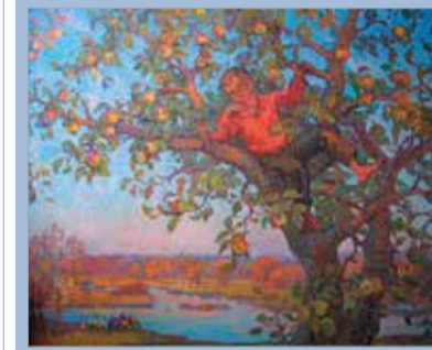
С.Ф. Шурпин. «В родном краю». 1990–е