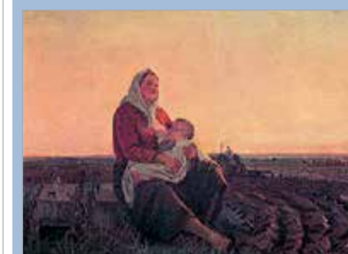
Ф.С. Шурпин. «Мать». 1947