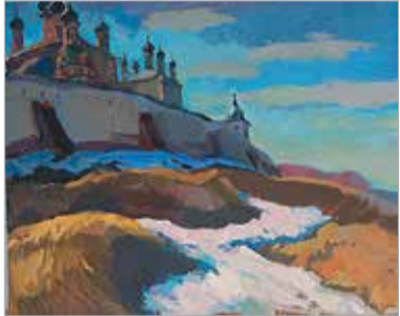
«Горицкий Успенский монастырь. Весна». 2016