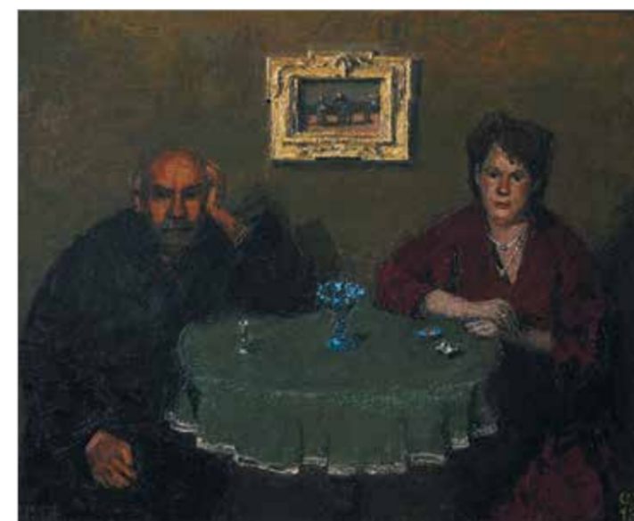
«Старосветские помещики». 2013