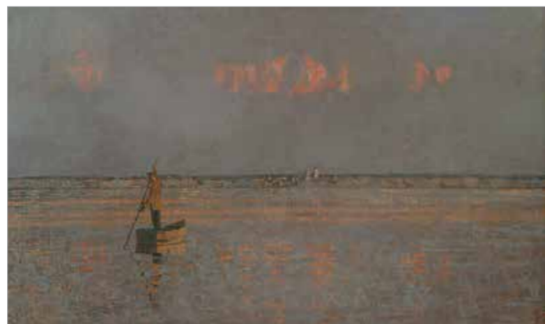
«Река времён». 2003

Творческие мастерские Российской академии искусств – уникальное, не имеющее аналогов явление в художественном образовании. Современные мастерские имеют более чем полувековую историю – это особая страница в становлении отечественного искусства, ценность российской и мировой культуры. При воссоздании Академии искусств в 1947 году, когда