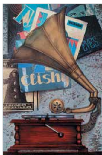
Е. Погорелов. «Забывшая мелодия»

Творческие мастерские Российской академии искусств – уникальное, не имеющее аналогов явление в художественном образовании. Современные мастерские имеют более чем полувековую историю – это особая страница в становлении отечественного искусства, ценность российской и мировой культуры. При воссоздании Академии искусств в 1947 году, когда