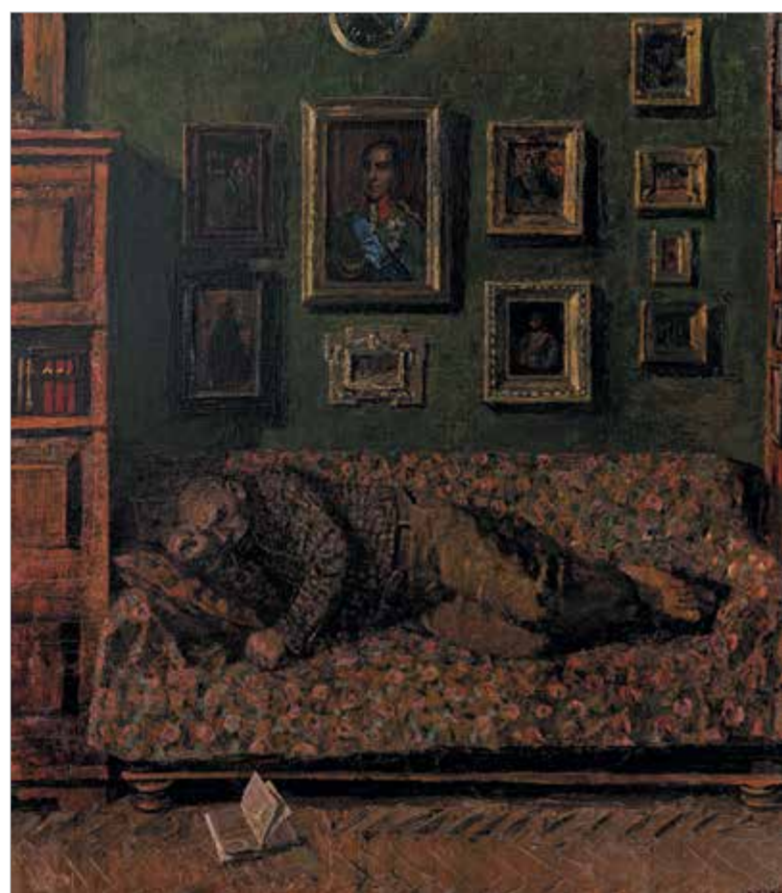
«Послеобеденный отдых с Кантом». 2012

Колорит поздних работ довольно мрачный, вечерний и комнатный, либо по-зимнему холодный. Фактура и детализация тщательна, что даёт ощущение какой-то особой сконцентрированности на мелочах, которые то тут, то там выдают собственную аллегоричность или раскрывают пышную нелепую быта. Складки на диване, книги, стихийные натюрморты кухонного стола, за которым ведутся диалоги, – всё это формирует довольно замедленный и очень рефлексивный мир художника-юбиляра, решающего заниматься отныне только главными, неспешными темами, будь то память и забвение, позиция художника во «всеобщей истории искусства» или же отношения с друзьями и товарищами. В московских двориках и квартирах казаку тесно, не хватает далёкого горизонта. Именно поэтому художник учится «путешествовать, не вставая с места» и превращает собственную комнату в главное поле разворачивания наблюдательности и кругозора.