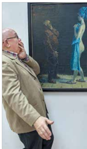
«Старик и Сусанна». 2015

Колорит поздних работ довольно мрачный, вечерний и комнатный, либо по-зимнему холодный. Фактура и детализация тщательна, что даёт ощущение какой-то особой сконцентрированности на мелочах, которые то тут, то там выдают собственную аллегоричность или раскрывают пышную нелепую быта. Складки на диване, книги, стихийные натюрморты кухонного стола, за которым ведутся диалоги, – всё это формирует довольно замедленный и очень рефлексивный мир художника-юбиляра, решающего заниматься отныне только главными, неспешными темами, будь то память и забвение, позиция художника во «всеобщей истории искусства» или же отношения с друзьями и товарищами. В московских двориках и квартирах казаку тесно, не хватает далёкого горизонта. Именно поэтому художник учится «путешествовать, не вставая с места» и превращает собственную комнату в главное поле разворачивания наблюдательности и кругозора.