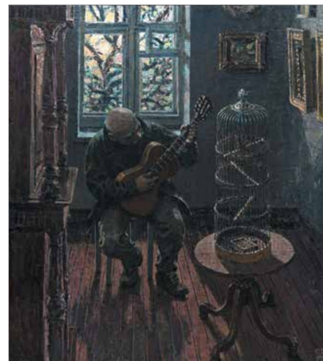
«Урок пения». 2014